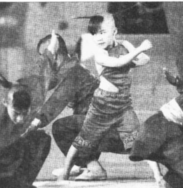
6月10日,全民健身展示大会在北京首都体育馆举行。这是北京武术队的小队员在进行武术表演。

在采访中记者深深感受到,在迈入国际市场的道路上,中国农业要走的还很远,而针对“绿色壁垒”它需要做的事更多。金瀚公司的发展,对区域农业如何突出重围,打造“绿色通道”进军国际市场和推进农业产业化进程都有一定的借鉴意义。本版编辑 牟玉娟 本版校对 宋卫国