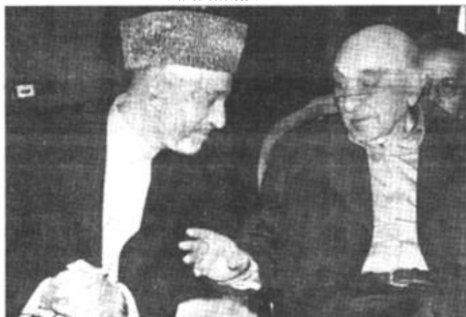
6月10日,阿富汗前国王查希尔(右)在喀布尔的府邸与临时政府主席卡尔扎伊会谈。查希尔在联合国记者招待会上发表声明,他不会完全支持卡尔扎伊竞选过渡政府领导,而他本人将不会在过渡政府中谋求任何职位。阿富汗大国民议会推迟到11日举行。

印度外交部发言人拉奥10日宣布,印度政府决定从当天起解除巴基斯坦民航飞机飞越印度领空的禁令。舆论认为,这是印度政府为缓和当前印巴紧张关系而迈出的重要一步。