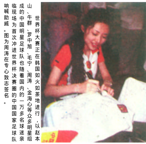
世界杯大赛正在韩国如火如荼地进行，以赵本山、牛群、罗中旭、毛宁、周涛、金海心等众多明星组成的中国明星足球队也随着国内的一万多名球迷亲临现场为首次冲进世界杯决赛圈的中国国家足球队呐喊助威。图为周涛在专心致志签名。

新闻热线：8328691 8331392 电子邮箱：dyrbs@sina.com 网址：http://www.dyrb.com 2002年6月12日 星期三 第62期 总第2732期 全国统一刊号：CN37-0054 邮发代号：23-172