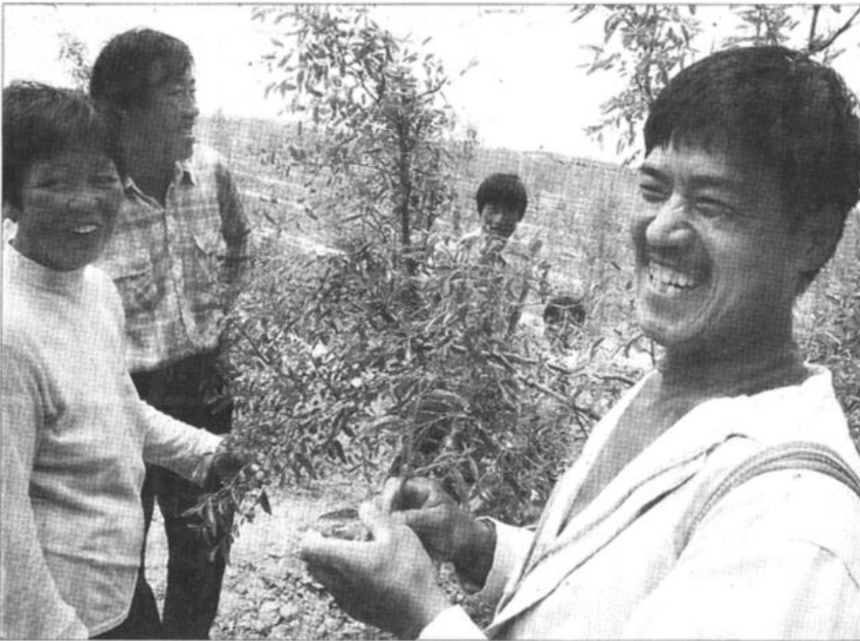
被全国绿化委员会命名为“全国绿化十佳村”的利津县虎滩乡郭西村把林业生产放在突出发展的位置，并在市林业局包村组的帮助下，逐步实现了向“名、优、特”方向发展。现全村已发展冬枣230亩，107杨树、白蜡等育苗180亩，林业面积占到全村土地的90%以上，同时也为村民带来了丰厚的收益。

本报讯 广饶农业银行取得了物质文明和精神文明的双丰收。最近，广饶农行在全国金融系统文明建设评比中荣获“全国金融系统文明建设先进单位”称号。据悉，获此称号的在全国总共有六家单位，广饶农行在我省金融系统中独获此称号。（王志峰 魏红光）