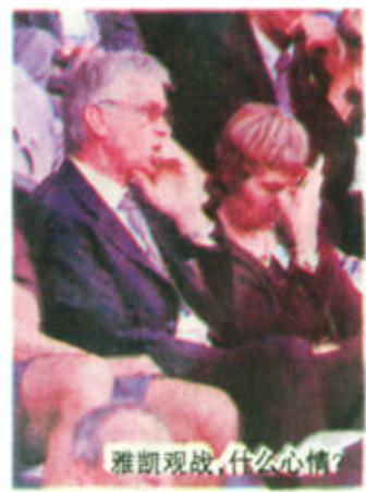
雅观观战，什么心情？