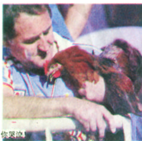
久久不愿离去的法国球迷！