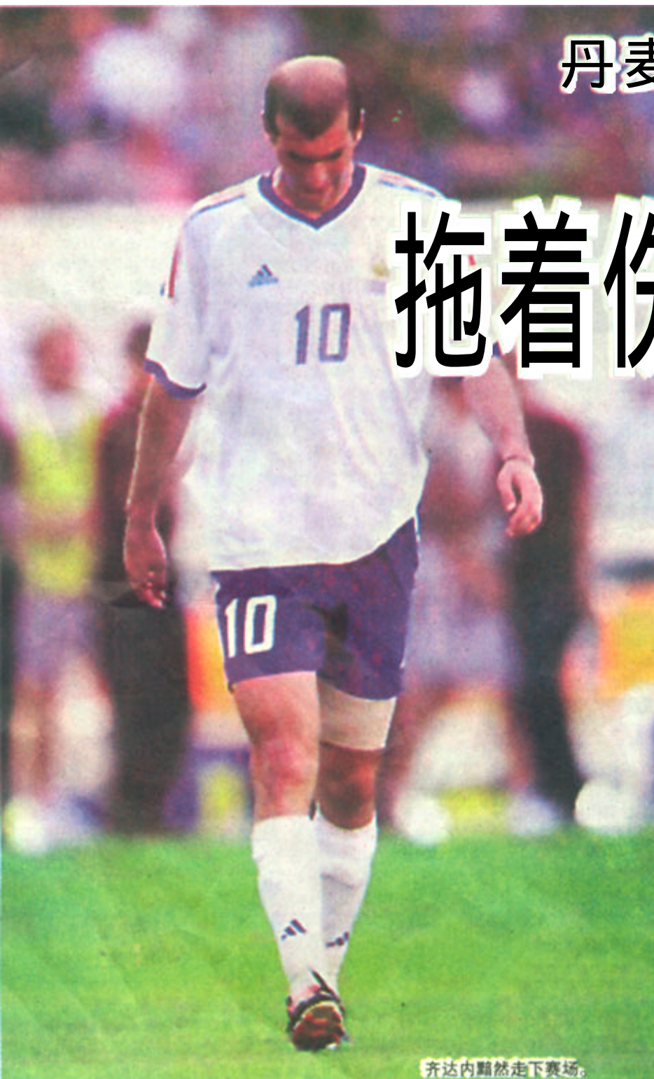
齐达内黯然走下赛场。

在本场比赛前，法国队的出线前景已非常严峻，许多的法国球迷集体停工和逃学来看这场关键的比赛，他们希望重返球场的齐达内能够挽救球队和国家的荣誉。在观看比赛的过程中，法国球迷不停地欢呼齐达内的昵称：齐祖！齐祖！他们希望法国队进球，一旦法国队队员错过良机，球迷们就痛苦得无地自容。当丹麦队攻入一球时，人群不禁爆发出可怕的尖叫，然后就是死一般的寂静。终场哨响起的时候，一个涕泪交流的球迷愤怒地指出：“这不是一支渴望获得胜利的球队。”