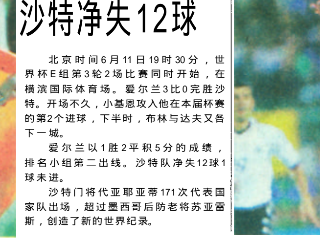
两个六号上演“地趟拳”