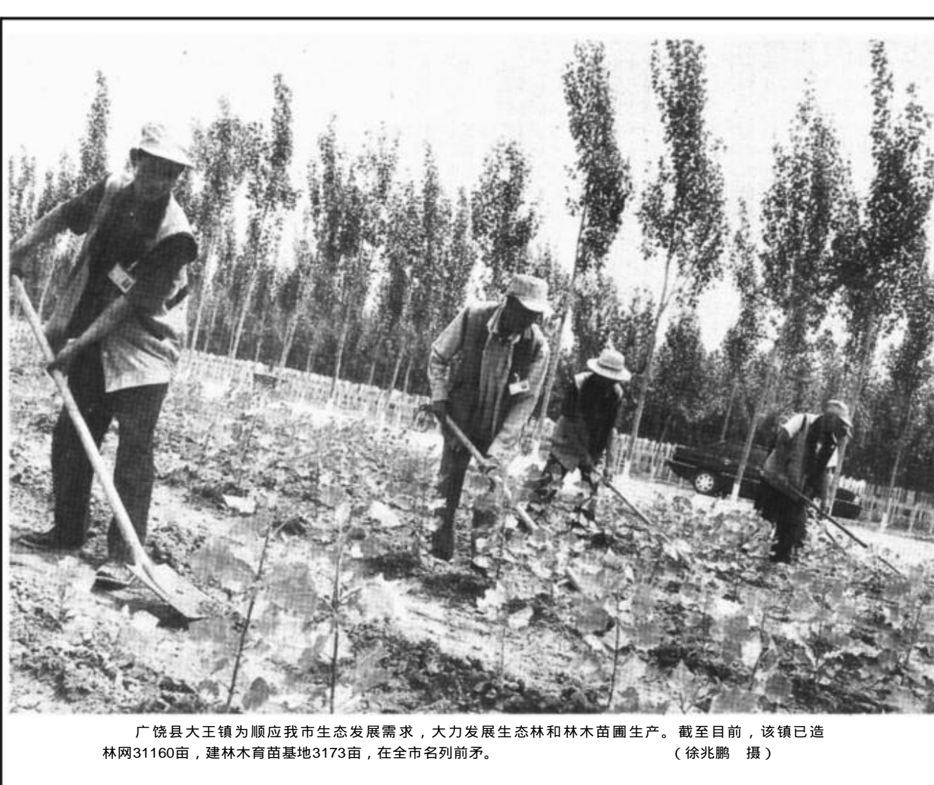
广饶县大王镇为顺应我市生态发展需求，大力发展生态林和林木苗圃生产。截至目前，该镇已造林网31160亩，建林木育苗基地3173亩，在全市名列前茅。

一是开展联合打假活动，特别是对食品、药品、医疗器械、农资等领域内严重侵害人民群众切身利益的制假售假行为进行严厉查处。二是加大建筑市场秩序整治力度，继续严查查处招投标弄虚作假和非法转包、违法分包及违反强制性标准等建筑市场违法违纪行为。