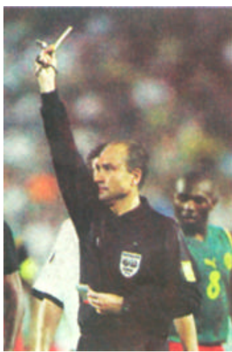
在丹麦队与德国队的比赛中，西班牙籍主教练托出示了十六张黄牌（其中有四张累计成为两张红牌），创造了世界杯单场红黄牌纪录，赛后内托也成为媒体报道焦点人物。