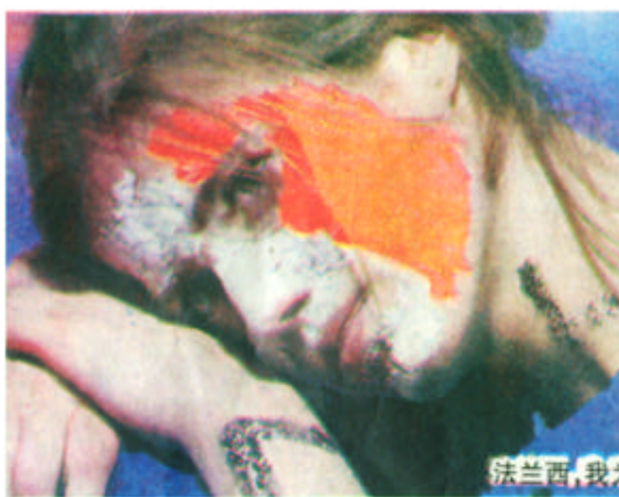
法兰西，我为你哭泣！