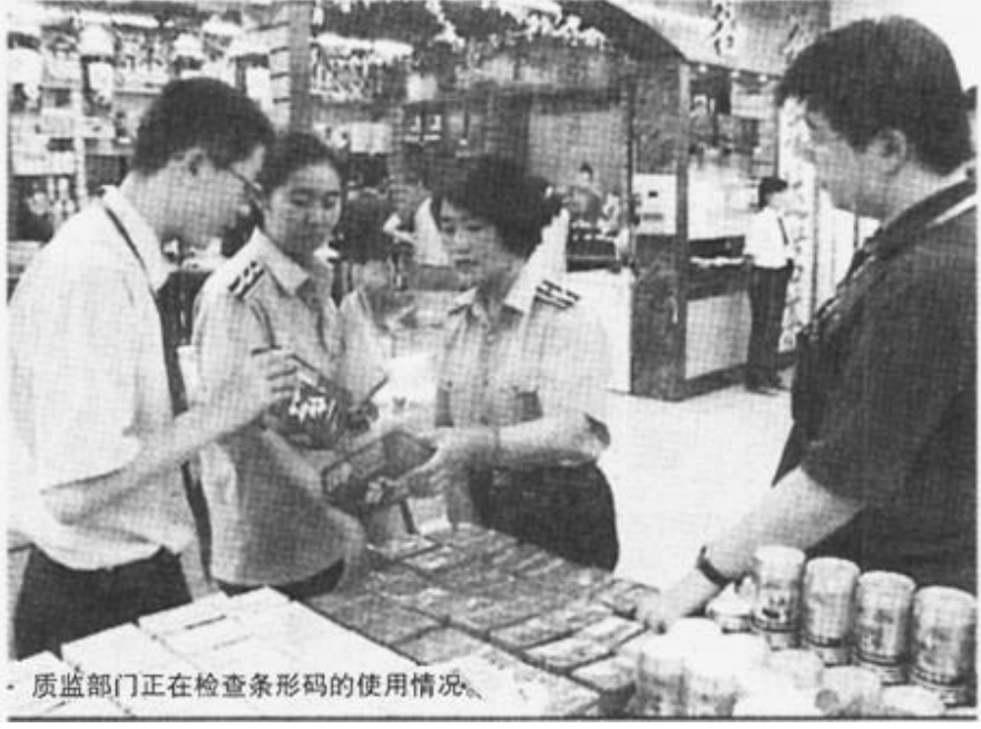
质监部门正在检查条形码的使用情况。