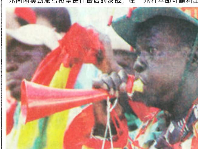
塞内加尔球迷“吹捧”助威

昨天A组最后一轮两场小组赛同时进行。韩国水原体育场,非洲新军塞内加尔同南美劲旅乌拉圭进行最后的决战。在此之前,四支球队均有出线机会。但仅积1分的乌拉圭队出线希望渺茫,而塞内加尔打平即可顺利出线。但双方在比赛中各打半场好球,3比3握手言和的结果让首次参加世界杯的塞内加尔爆冷挤掉卫冕冠军法国队小组出线。